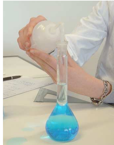
On complète jusqu'au trait de jauge avec de l'eau distillée.

Conclusion la concentration inconnue en sulfate de cuivre est voisine de 0,05 \text{ mol.L}^{-1} .