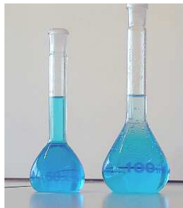
On prélève 50 mL de la solution mère avec une fiole jaugée de 50 mL puis on verse cette solution dans la fiole de 100 mL et on complète avec de l'eau distillée.