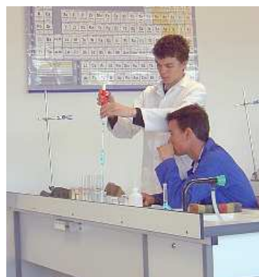
On prélève 10 mL de solution mère avec la pipette jaugée de 10 mL.